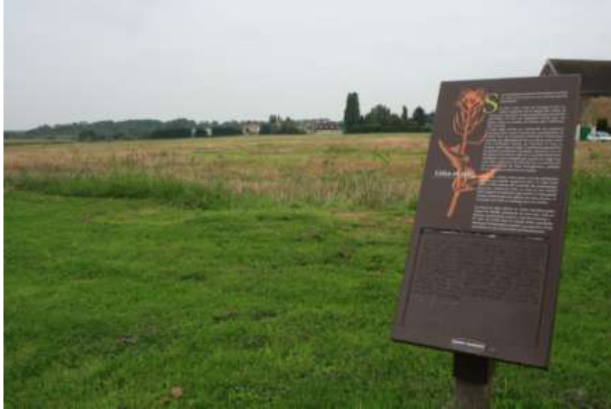
Figure 3 : Panneau de sensibilisation