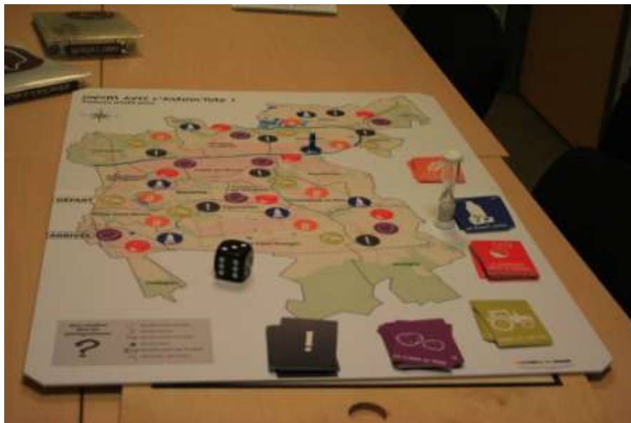
Figure 8 : Le jeu de la malle