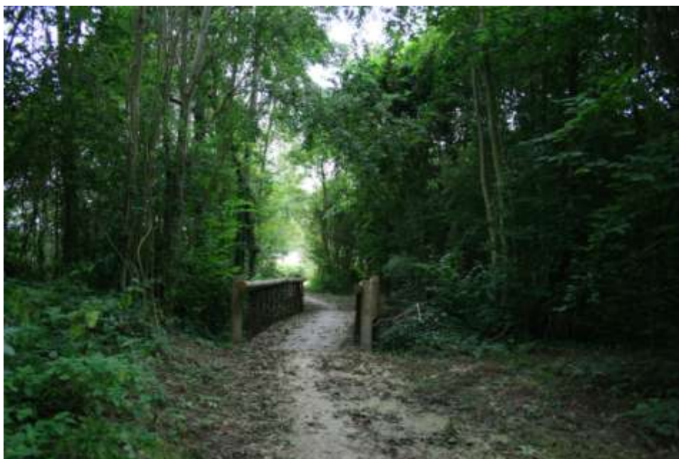
Figure 6 : L'un des sentiers de la vallée de la Brosse