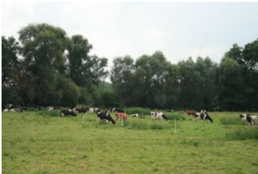
Figure 5 : Le cheptel

La gestion de cette fauche a été confiée à un agriculteur du secteur, exploitant d'une ferme laitière dans le cadre d'un marché public. En effet, ce dernier dispose du matériel adapté et le produit de fauche est directement utilisé pour l'alimentation de son bétail. Cette action permet de participer à l'activité économique de l'exploitation agricole (récupération des produits de coupe) tout en préservant la biodiversité de la prairie mésophile. Cette gestion par l'agriculteur le sensibilise aux pratiques favorables à la biodiversité et lui permet de disposer de foin pour ses animaux (cheptel de 40 vaches).