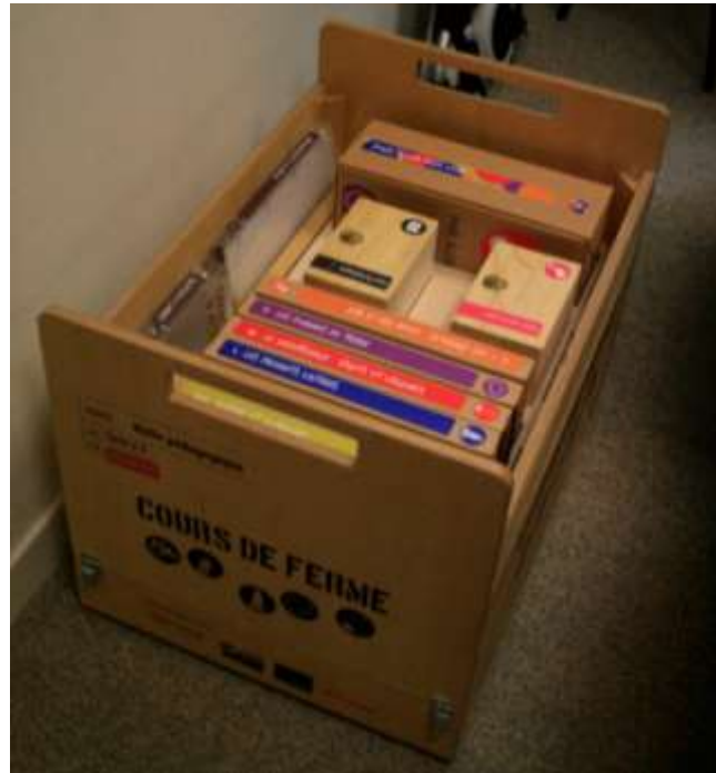
Figure 7 : L'une des malles pédagogiques