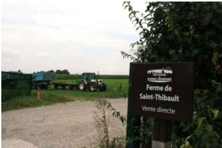
Figure 2 : L'un des panneaux de signalisation

Aussi, pour valoriser les exploitations du territoire, Marne-et-Gondoire a développé un logo « Ferme de Marne-Gondoire » qui permet d'identifier les points de vente directe sur le territoire.