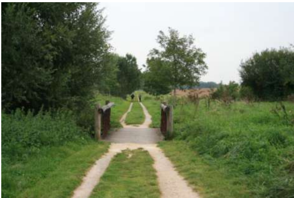
Figure 4 : La prairie restaurée et le cheminement nouvellement créé

La Communauté d'Agglomération de Marne et Gondoire a réhabilité, en 2002, la vallée de la Brosse (partie comprise dans le site classé des vallées des rus de la Brosse et de la Gondoire et au sein du secteur III de Marne-la-Vallée). Il a été ainsi créé et réhabilité 13,5 ha de prairie mésophile.