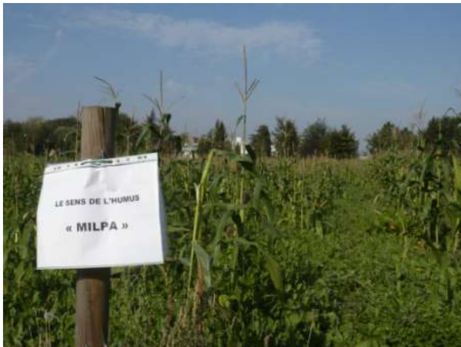
Figure 7 : La zone de Milpa

Différentes actions en rapport avec l'agriculture ont été mises en place dans le parc. Sur la zone de prairie, un espace a été laissé en gestion à l'association Le sens de l'humus pour la mise en place de la Milpa : cette technique agricole associe trois cultures (maïs, haricots et courges) et servira d'espace de sensibilisation et de formation à la permaculture jusqu'en octobre.