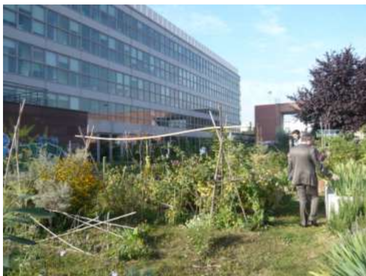
Figure 3 : Le jardin partagé de la dalle Hannah Arendt