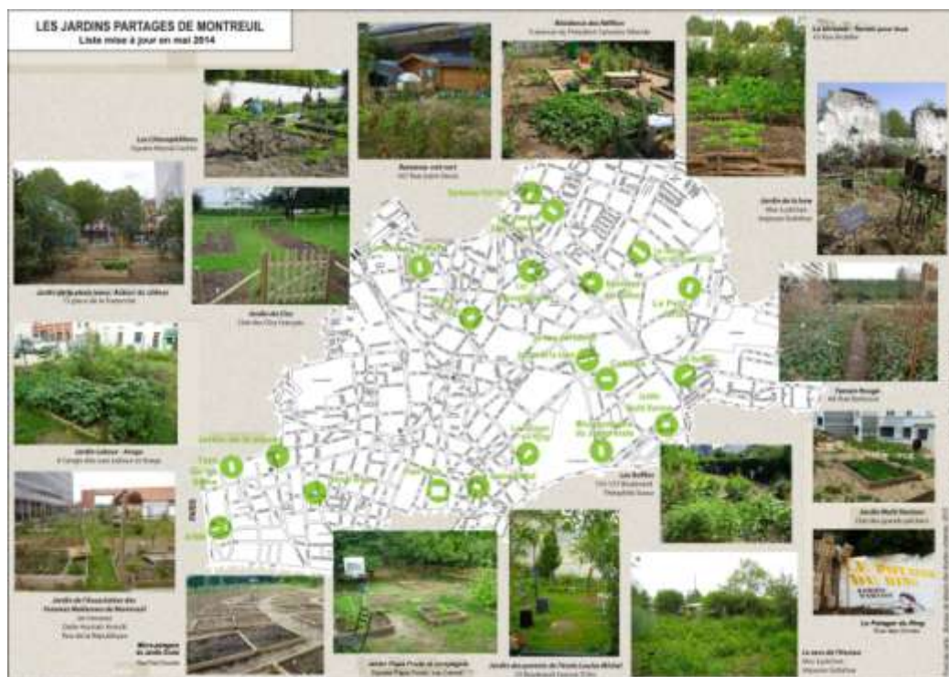
Figure 2 : Carte des jardins partagés de Montreuil