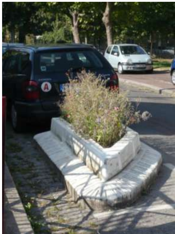
Figure 10 : Un terre-plein végétalisé

Des terre-pleins font aussi l'objet d'une végétalisation dans certaines zones de la ville.