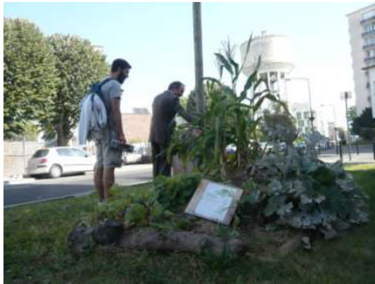
Figure 4 : Un espace partagé dans le quartier Bel Air