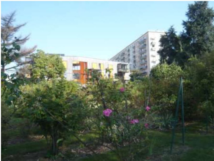
Figure 9 : Le jardin école

Le jardin école est situé sur un terrain communal pour lequel la société régionale d'horticulture de Montreuil jouit d'un bail emphytéotique. Cette association vieille de plus de 130 ans a fait bénéficier la ville de la renommée de ses horticulteurs. Et se charge de valoriser des savoirs faire arboricole pour certain tombé en désuétude. Depuis dix ans, elle mène un programme d'action dynamique tourné vers le quartier et les écoles. Elle a par exemple proposé un programme d'activité sur le thème « Patrimoine, pêches, pommes et potagers » dans le cadre d'un appel à projet des écoles « classes de ville ». Cette formation se déroulera sur deux semaines en mars 2015. L'association organise aussi des ateliers pédagogiques pour les écoles et accueille chaque année depuis 2008 la ferme pédagogique temporaire (plus de 3 000 visiteurs par an).