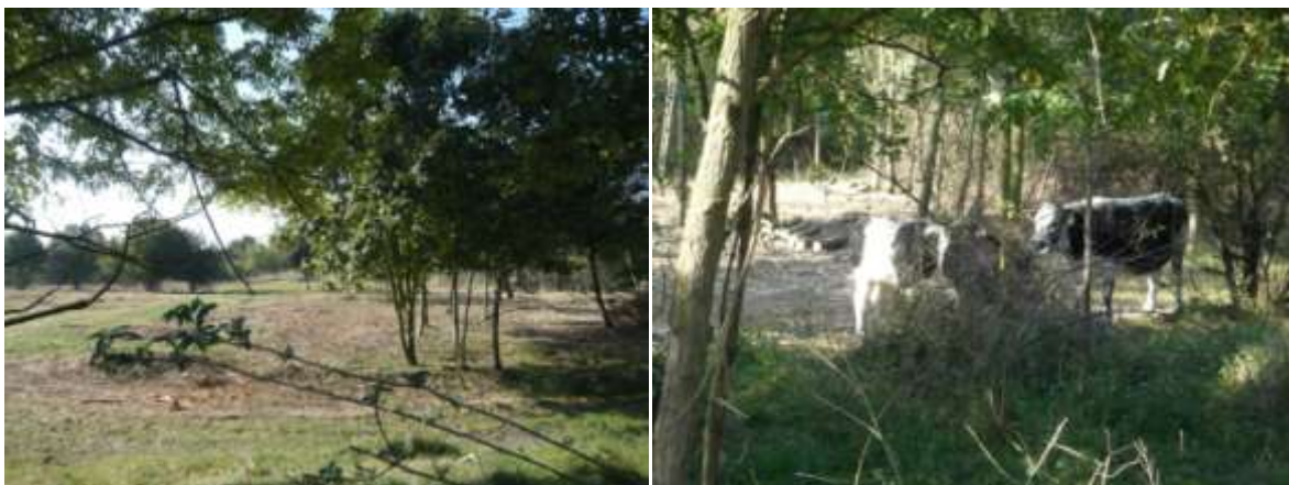
Figure 8 : La zone réhabilité et ses vaches

La ville a également mis en place de l'éco-pâturage avec deux vaches à pie noire ! et des chèvres, notamment sur la zone du parc qui a connu récemment un chantier de réhabilitation de milieux ouverts favorables aux haltes migratoires de la Pie-grièche écorcheur. Ce bétail est loué à un berger local entre avril et octobre.