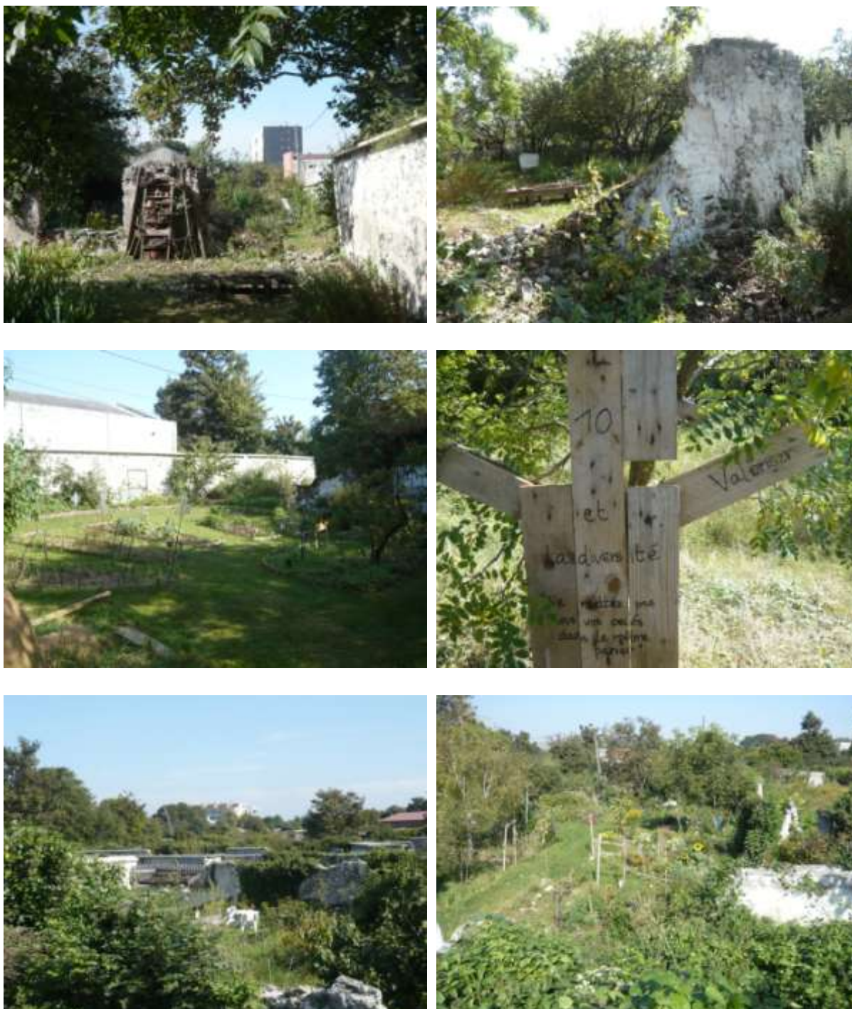
Figure 6 : Une partie de la zone des murs à pêches