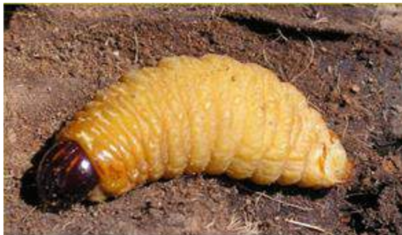
Larve du charançon rouge