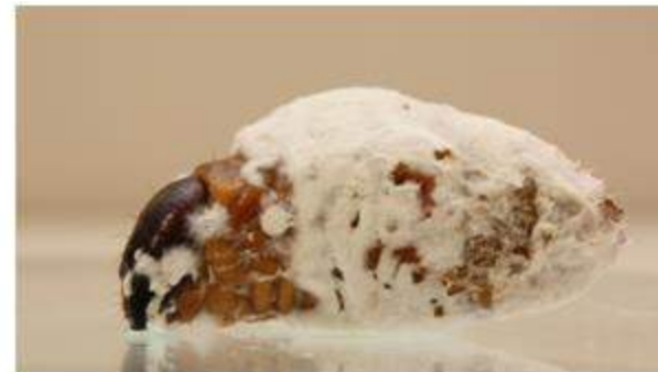
Larve du charançon rouge mycosée