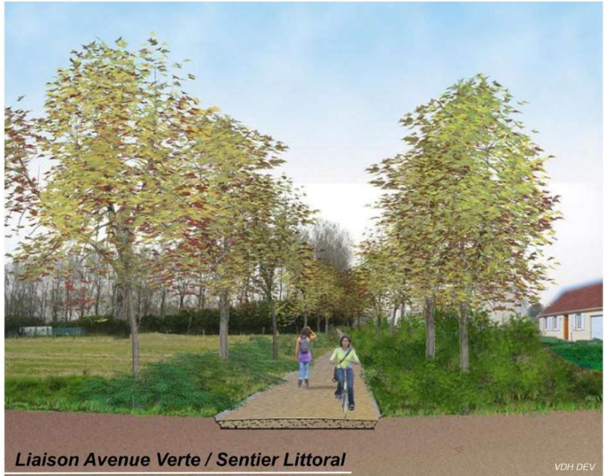
Liaison Avenue Verte / Sentier Littoral

La jonction entre le sentier du littoral et l'avenue verte cyclable